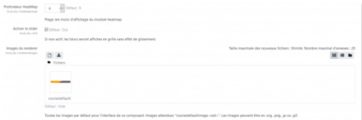
Image par défaut retenue pour les cours sans illustration dans les paramètres de cours.