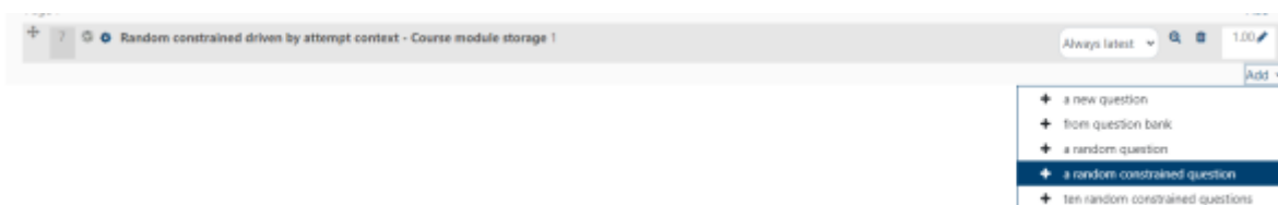
Illustration : Ajout d'une question aléatoire à contrainte dans un test

La contrainte est exprimée au moment de l'exécution du quiz par l'apprenant. C'est lui qui détermine le champs de catégories qui est explorable. Dans le plateau, c'est le plateau lui-même qui demande au candidat de choisir sa racine de révision, et appliquera cette racine à toutes les questions à contraintes qui sont dans le quiz qui correspond à la bonne volumétrie de tirage. La sélection "à priori" (au niveau de la définition de la question) de la catégorie de tirage ne fait pas sens. Elle est simplement conservée du fait de l'héritage de ce type de question aux questions aléatoires classiques.